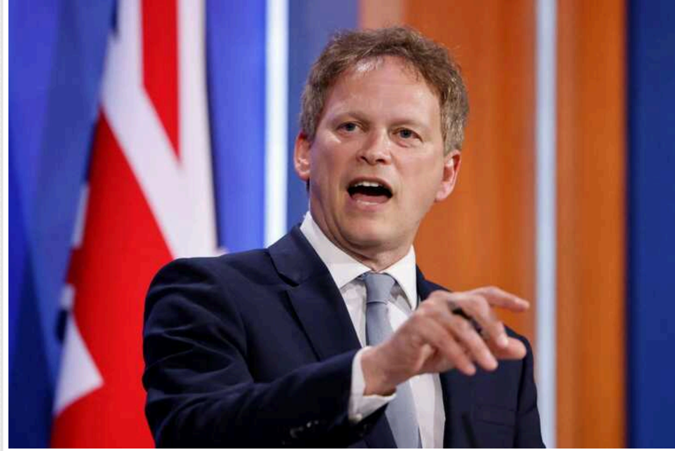
Експіністр оборони Британії закликає скасувати обмеження на атаки Storm Shadow по території РФ

Колишній міністр оборони Великої Британії Грант Шаппс заявив, що Лондон повинен зняти обмеження на використання Україною ракет Storm Shadow для ударів по цілях на території Росії.