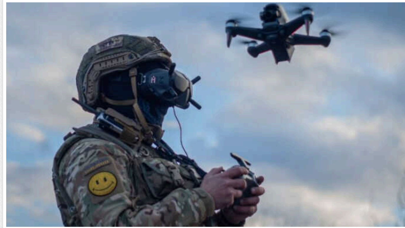
ЗСУ почали використовувати дрони, оснащені термітною сумішшю

Вони миттєво підпалюють рослинність, пропалюють метал і завдають шкоди великим скупченням військ.