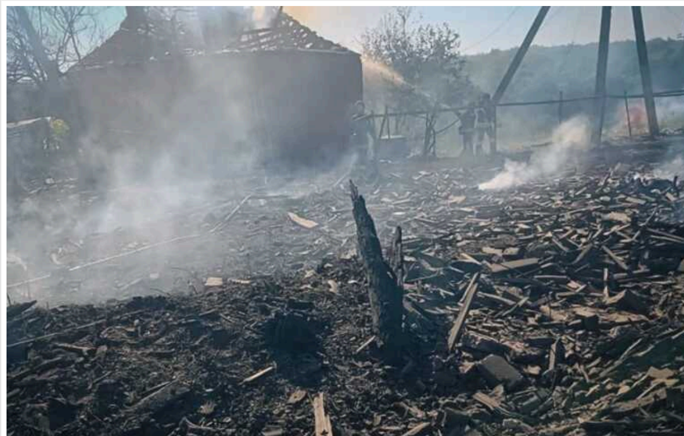
Окупанти завдали понад 200 ударів по Сумщині: 6 поранених

Протягом минулої доби ворог здійснив атаки на 32 населені пункти Сумської області. Зафіксовано 210 ударів. Внаслідок обстрілів одна особа загинула, шестеро отримали поранення, серед поранених – діти.