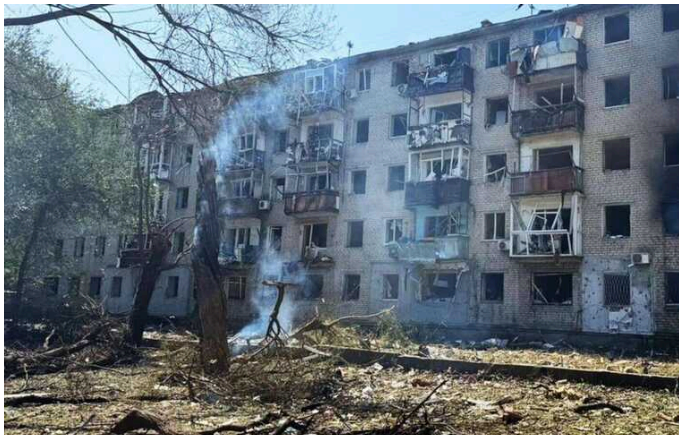
Кількість постраждалих у Павлограді збільшилася до 74 осіб

Кількість постраждалих у Павлограді (Дніпропетровська область) зростає до 74 осіб, повідомив голова обласної військової адміністрації (ОВА) Сергій Лисак.