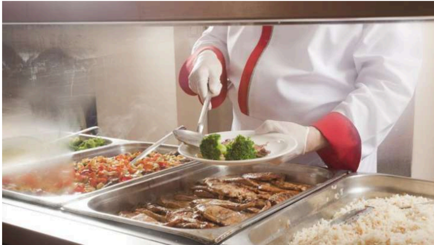
Шкільна їдальня

З 1 вересня безкоштовні теплі обіди у школах по всій Україні отримуватимуть усі учні 1-11 класів. Про це повідомила прем'єр-міністерка Юлія Свириденко за пудсумками наради з керівниками ОВА.