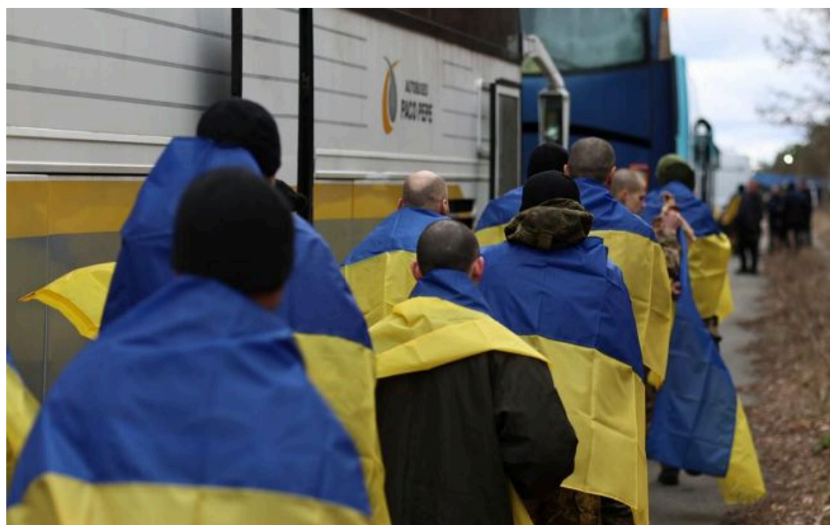
Фото: Переговори тривають: ГУР пояснив, коли розкриють деталі наступного обміну (facebook.com zelensky.official)