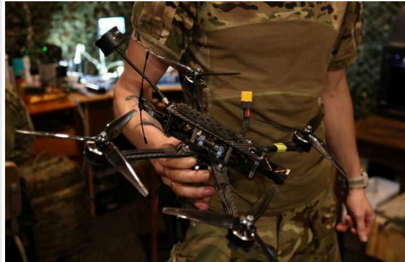
Одеські бійці показали, як збили новий ворожий "Ланцет" за допомогою FPV-дрона

Одеські воїни 11-ї бригади Національної гвардії успішно збили нову модифікацію російського дрона-камікадзе "Ланцет" під назвою "Виріб-51". Противник надіслав БПЛА на українські землі, але, завдяки влучній роботі наших захисників, дрон не досяг своєї мети.