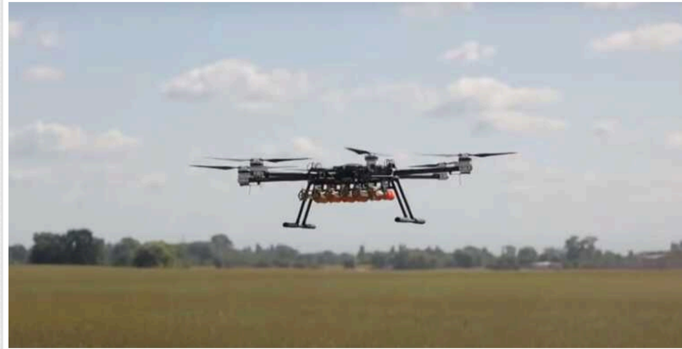
Український дрон "Королева шершнів" ефектно відпрацював по позиціях окупантів з автомата

Нова версія українського FPV-дрона "Королева Шершнів" тепер здатна знищувати російських окупантів за допомогою автоматичної зброї. Українська команда розробників безпілотників "Дикі Шершні" продемонструвала, як Сили оборони України використовують FPV-дрон "Королева Шершнів", оснащений автоматом.