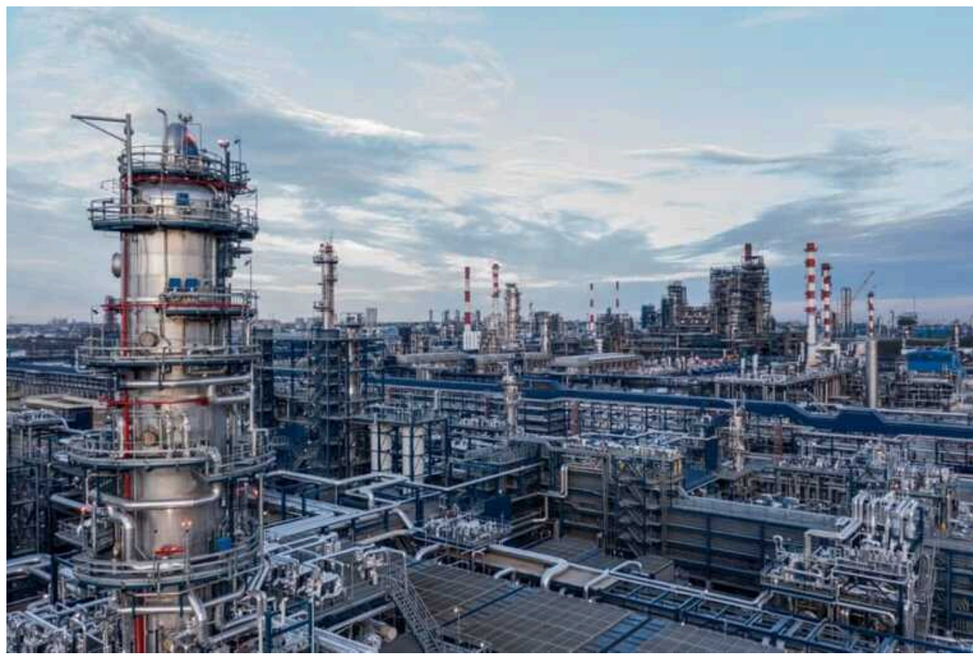
У Росії озвучили причину вибуху на Омському НПЗ

Вибух на Омському НПЗ стався через порушення техніки безпеки та поєднання ремонтних робіт із газонебезпечними. Семеро співробітників отримали травми, один загинув.