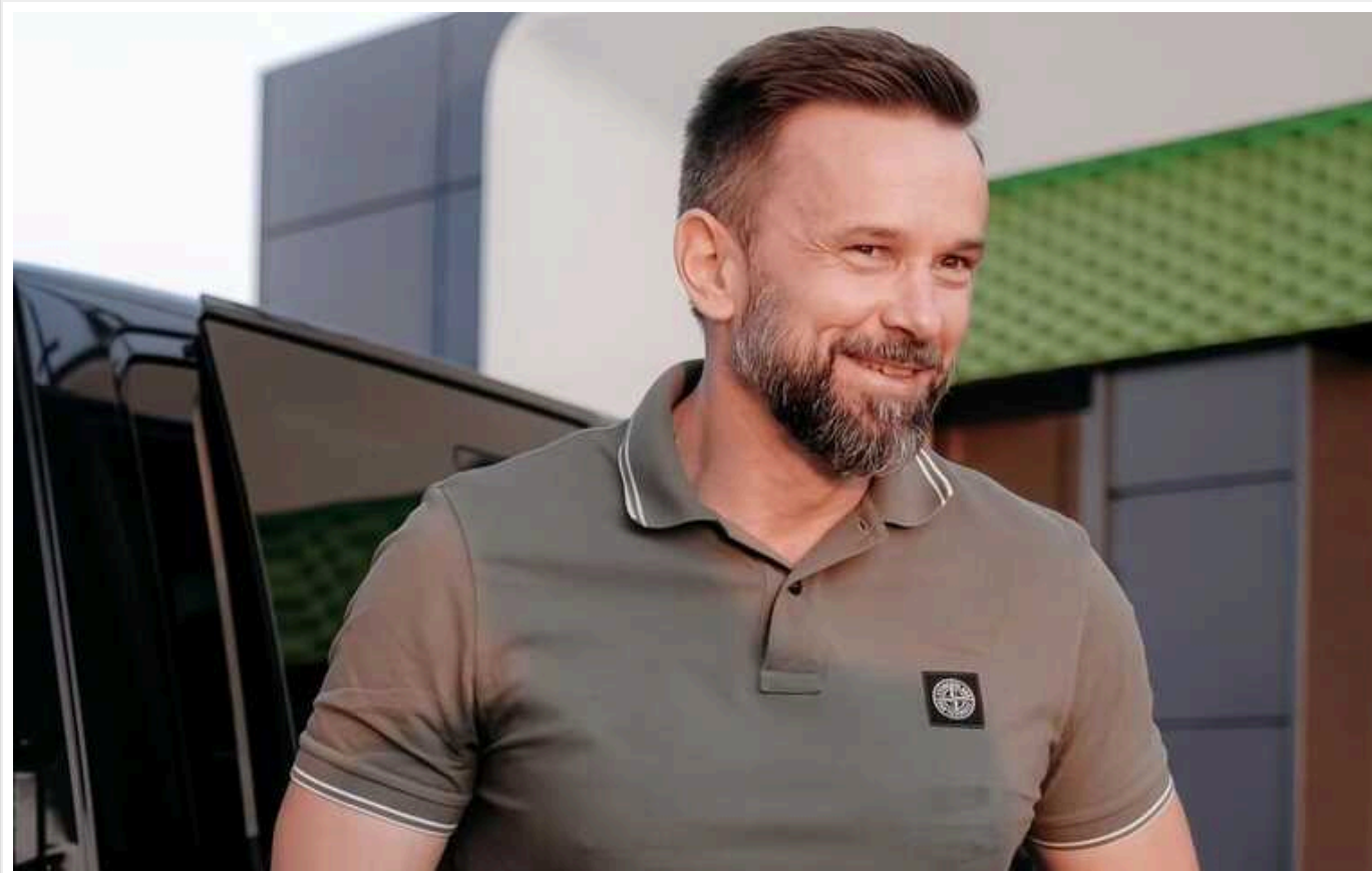
Уряд звільнив очільника Закарпатської ОВА

6 вересня український уряд звільнив голову Закарпатської обласної військової адміністрації (ОВА) Віктора Микиту.