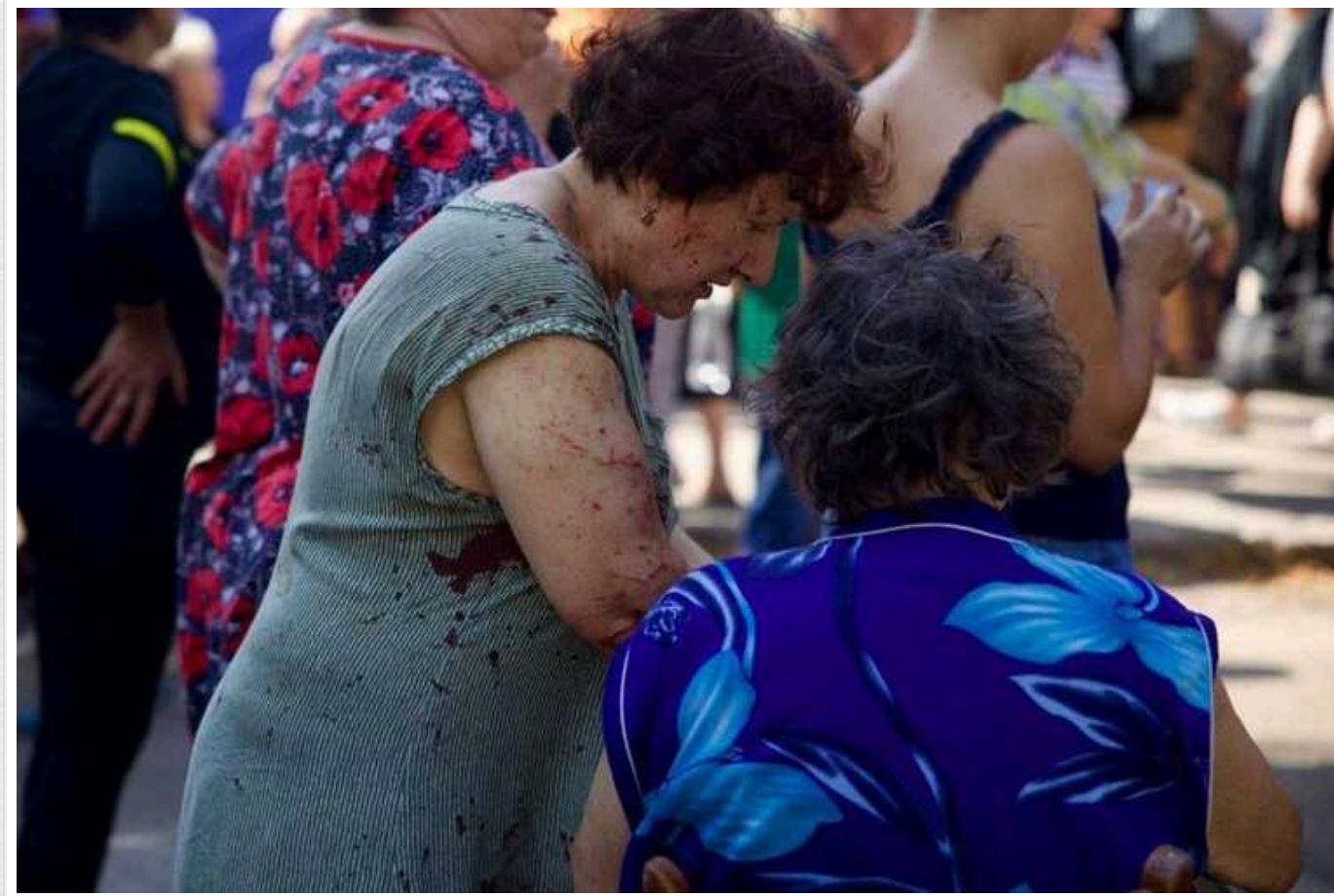
Кількість постраждалих внаслідок ракетного удару по Павлограду зросла до 55, один загинув

Внаслідок ракетних атак на Павлоград постраждали 58 осіб, із них 5 дітей. Пошкоджено понад 30 багатопверхових будинків, дитячий садок, магазини та підприємства. Створено пункти допомоги.