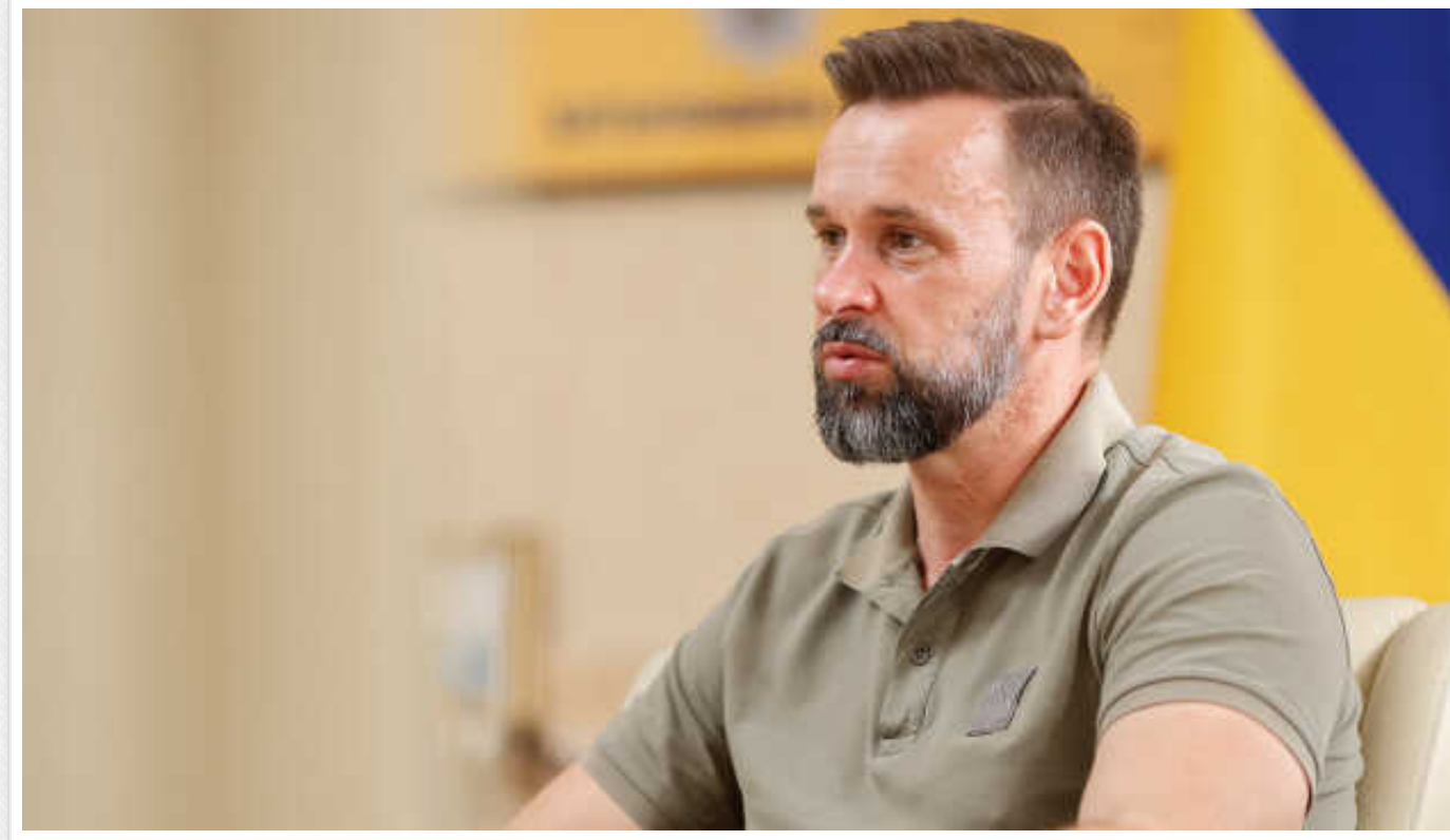
Уряд ухвалив рішення про звільнення голови Закарпатської обласної державної адміністрації Віктора Микити

Кабінет Міністрів ухвалив рішення про звільнення Віктора Микити з посади голови Закарпатської обласної державної адміністрації.