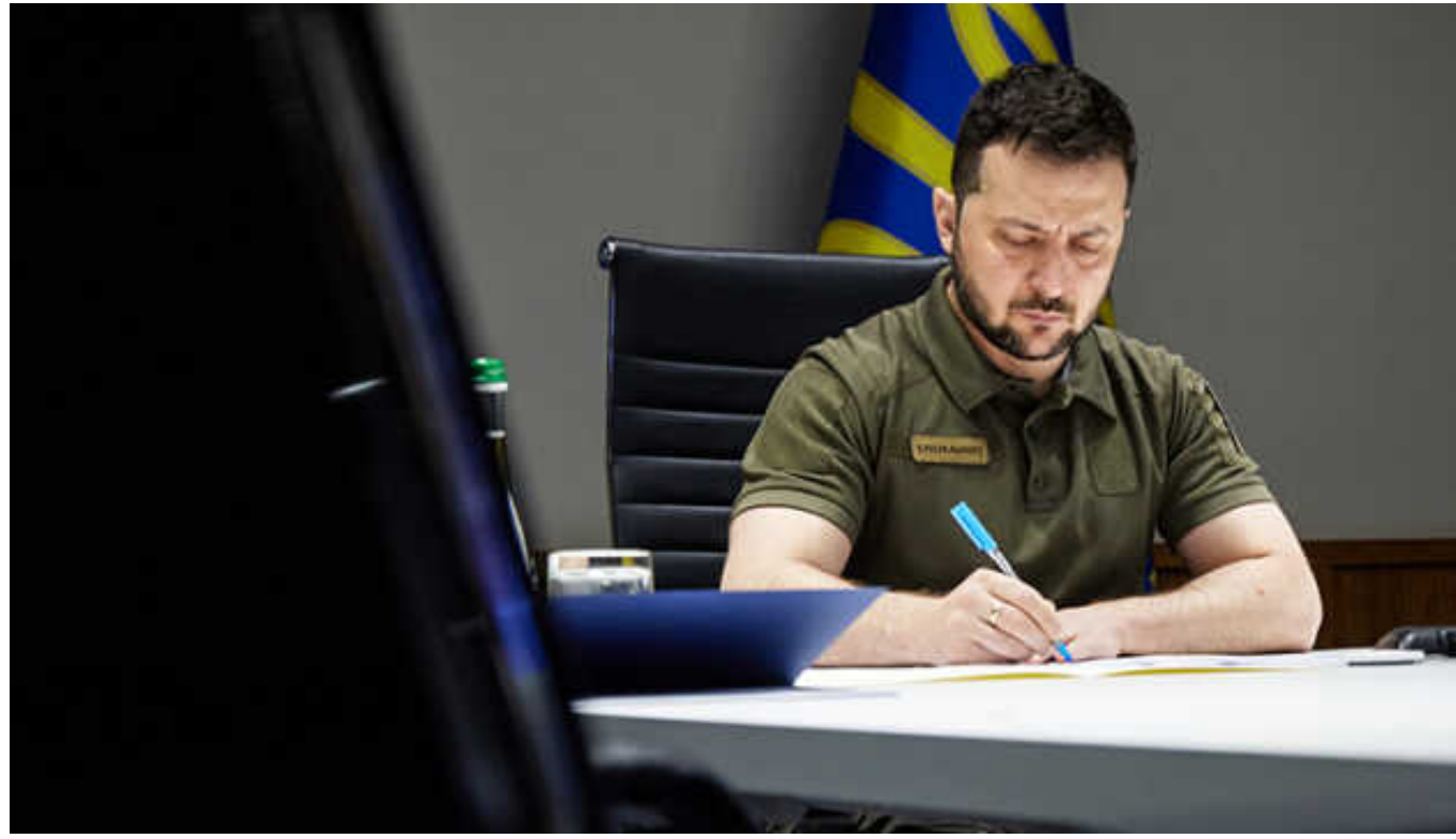
Президент звільнив трьох заступників Єрмака

Президент України Володимир Зеленський звільнив трьох заступників керівника Офісу президента. Він підписав відповідні укази.