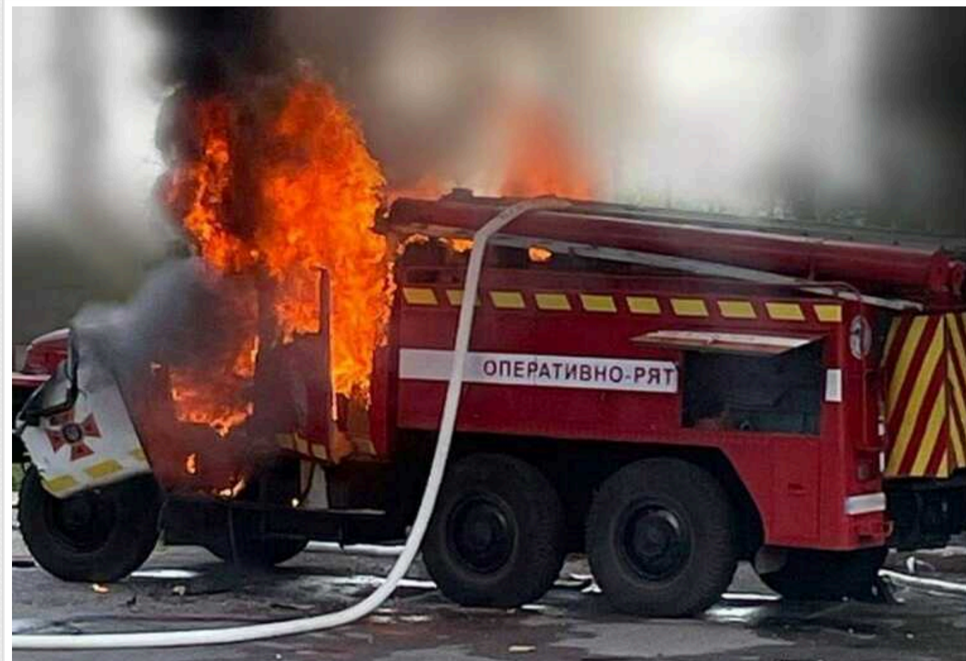
На Дніпропетровщині внаслідок дронавої атаки постраждав рятувальник

Окупанти продовжують обстрілювати Дніпропетровську область, не шкодуючи ні мирних жителів, ні працівників, які займаються ліквідацією наслідків атак. Внаслідок чергового удару в регіоні постраждав рятувальник.