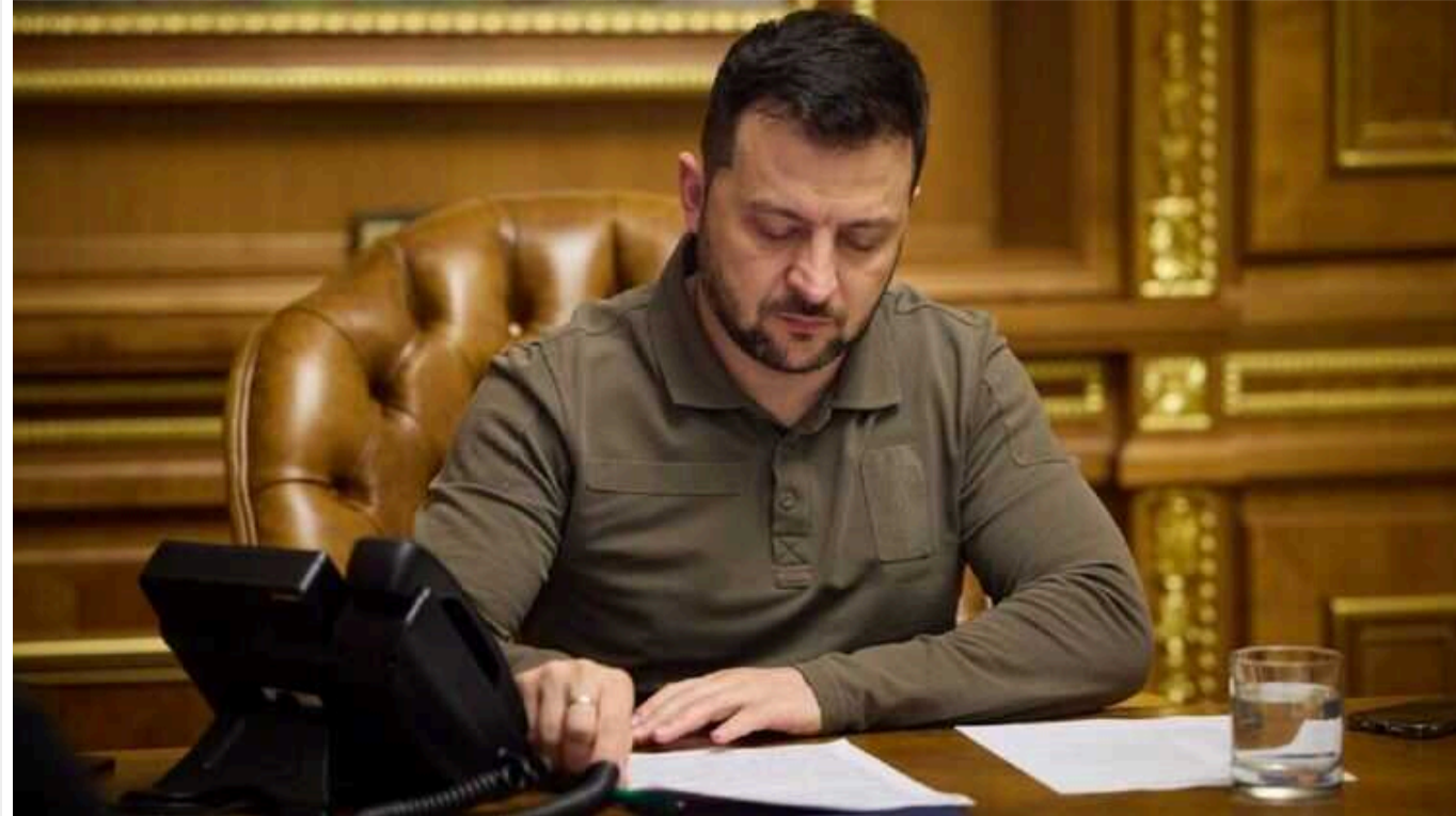
Зеленський провів кадрові перестановки в уряді через падіння популярності, – The Economist

Президент України Володимир Зеленський провів кадрові зміни в уряді на фоні зниження своєї популярності.