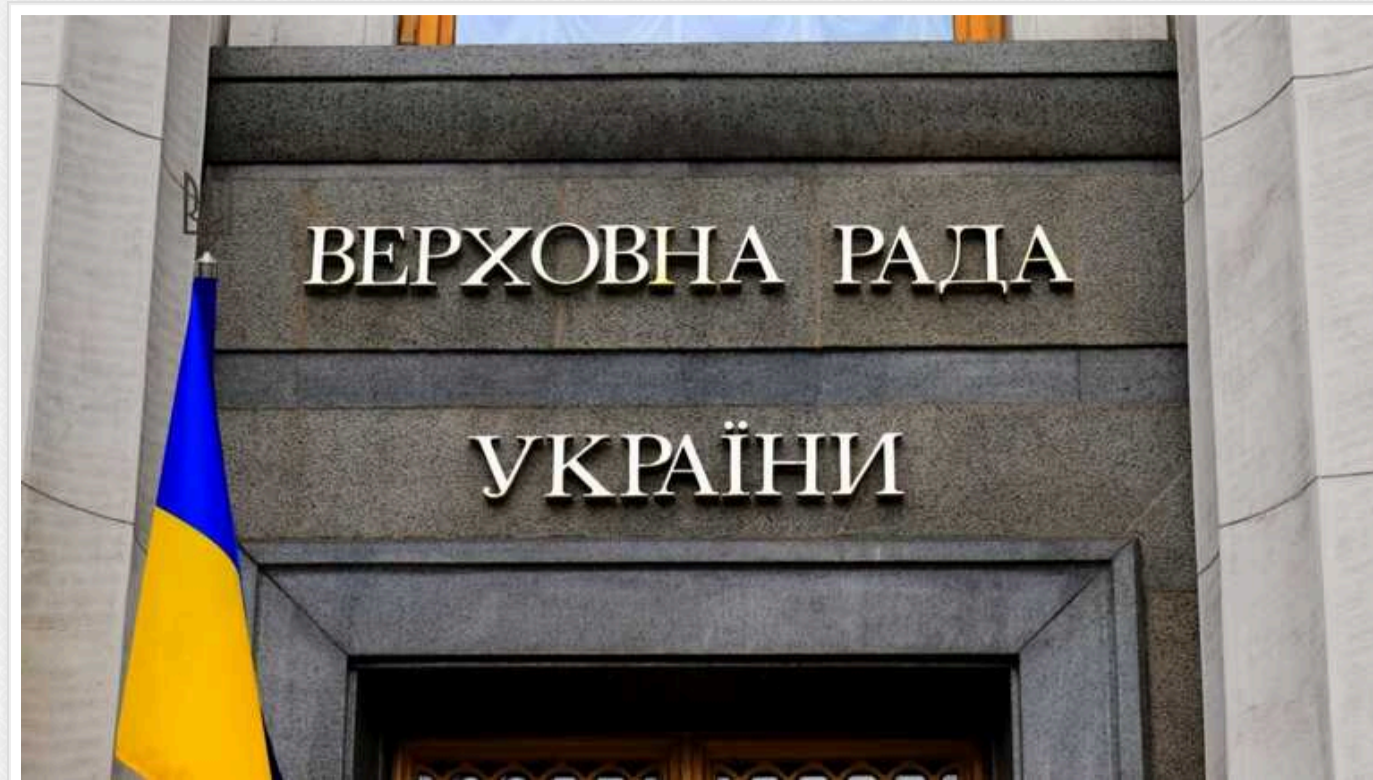
У Раді відбудуться всі кадрові голосування: планують звільнити Верещук, Кулебу та Ковалю

Сьогодні у Верховній Раді проведуть всі кадрові голосування з приводу звільнення та призначення нових міністрів.