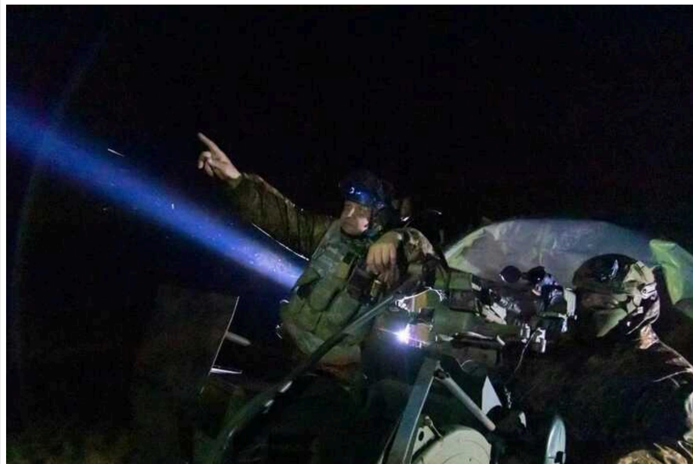
Атака дронів на Київ: тривога тривала понад 9 годин, жоден «шахед» не досяг цілі

Під час атаки РФ на Київ у ніч з 4 на 5 вересня, жоден дрон не досяг своєї цілі. Атаки відбувалися не групами, а тривога тривала більше 9 годин.