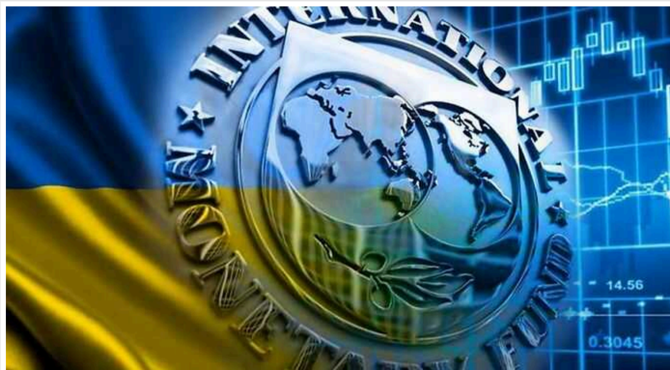
МВФ та Україна розпочали обговорення фіскальних реформ

Керівництво Міністерства фінансів та Національний банк України спільно з місією Міжнародного валютного фонду 4 вересня розпочали обговорення заходів економічної та фінансової політики в рамках п'ятого перегляду програми EFF.