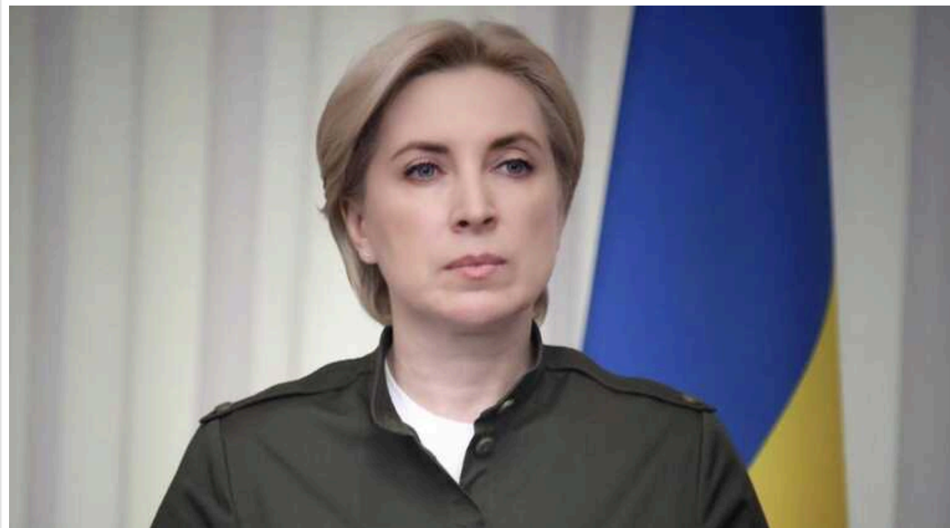
Верещук після звільнення з Кабміну може отримати посаду в Офісі президента, - ЗМІ

Віцепрем'єрка з реінтеграції Ірина Верещук у разі її звільнення з посади може стати заступником голови Офісу президента. Ймовірно, вона займе місце Юлії Соколовської.