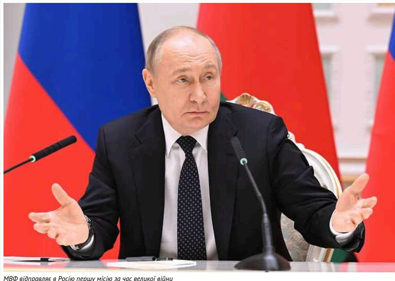
МВФ відправляє в Росію першу місію за час великої війни

Міжнародний валютний фонд (МВФ) вперше з початку повномасштабної війни в Україні планує відправити місію до Росії. Робота місії розпочнеться в онлайн-форматі 16 вересня і продовжиться візитом делегації МВФ до Москви для зустрічей з російськими офіційними особами (до 1 жовтня). У зв'язку з цим рішення МВФ вже викликало різку критику в Україні. Паралельно Фонд розпочав переговори з Україною про розширене фінансування.