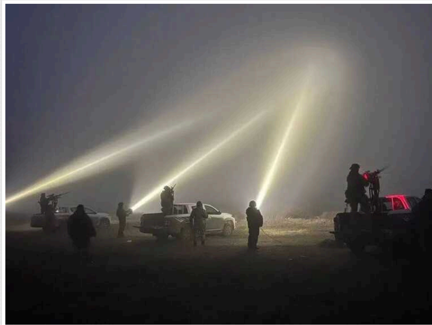
WSJ: Атака на Полтаву виявила нестачу ППО в Україні та недоліки в армії

Цей обстріл спровокував активні обговорення щодо дозволу на удари далекобійною зброєю з боку США.