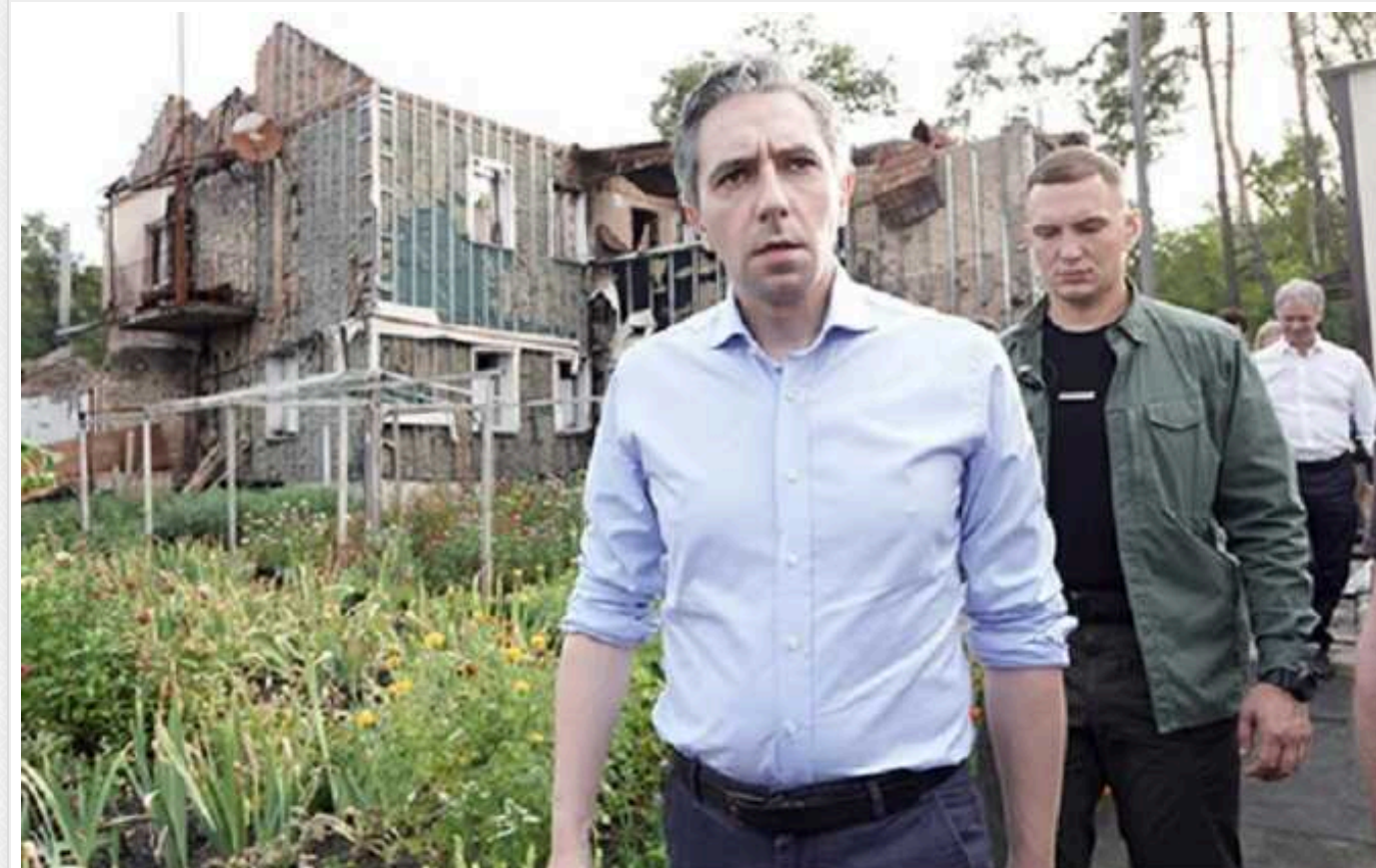
Прем'єр Ірландії відвідав Бородянку й Гостомель та зустрінеться з Зеленським

Сьогодні, 4 вересня, прем'єр-міністр Ірландії Саймон Гарріс прибув в Україну. Він має намір зустрітися з президентом Володимиром Зеленським.