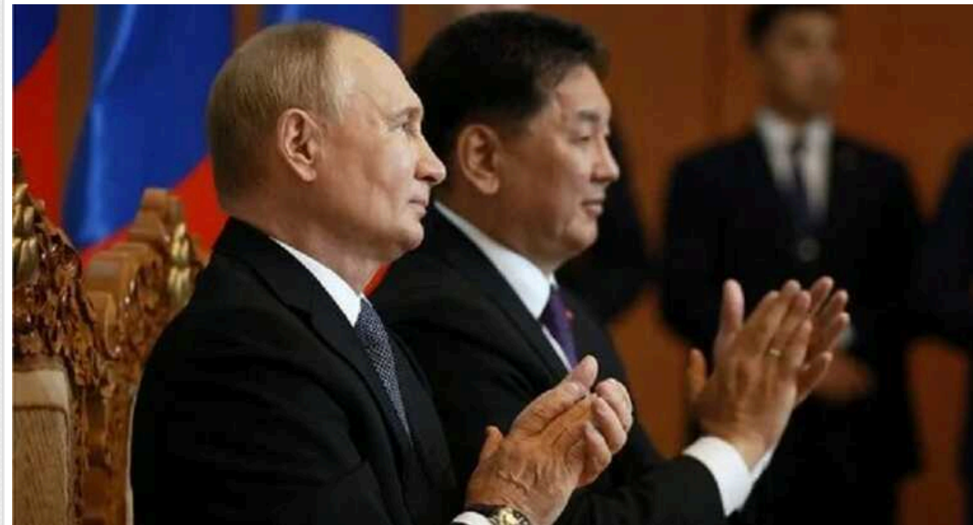
У Держдепі США відреагували на візит Путіна до Монголії, де його так і не заарештували

Державний департамент США висловив свою позицію щодо офіційного візиту лідера кремльського режиму Володимира Путіна до Монголії та відмови уряду цієї країни щодо його арешту, незважаючи на ордер Міжнародного кримінального суду.