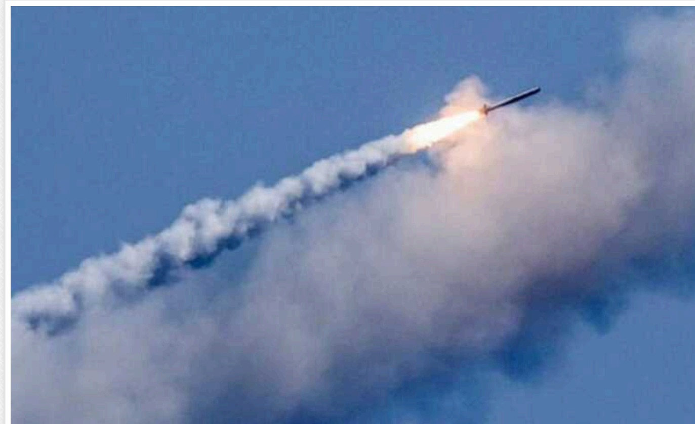
Масована атака на Україну: куди летіла більшість ворожих ракет і дронів

У ніч проти середи, 4 вересня, російські війська здійснили масований ракетний напад на Україну. Більшість ракет і дронів, які використовував ворог, було спрямовано на Львів та область.