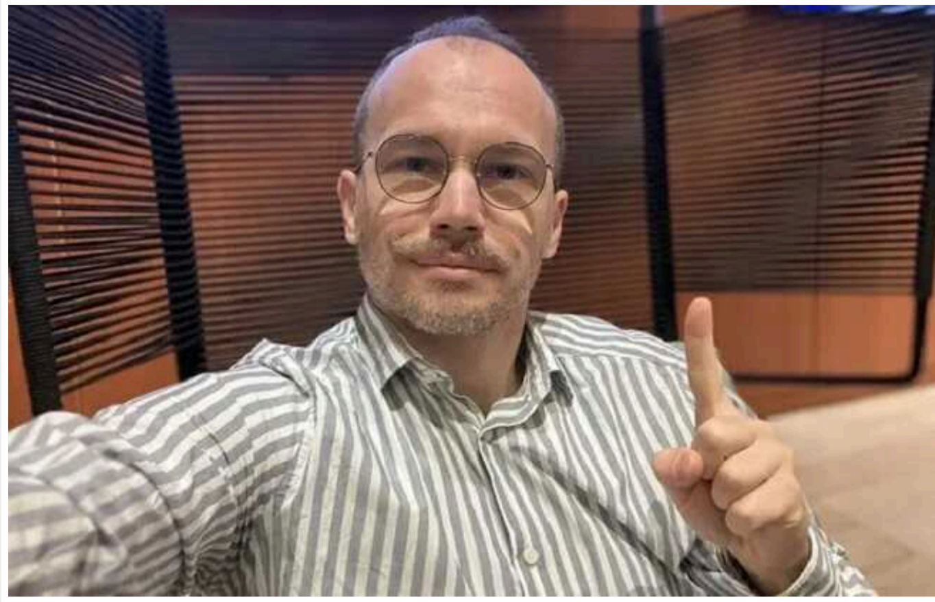
Рада відправила у відставку міністра юстиції Малюську

Верховна Рада ухвалила рішення про відставку міністра юстиції Дмитра Малюського. Він обіймав цю посаду впродовж п'яти років.