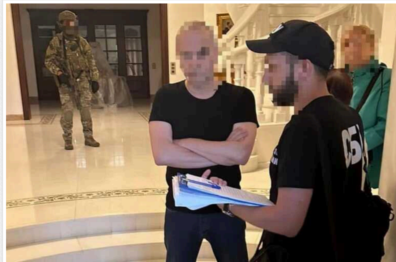
Судитимуть народного депутата України Нестора Шуфрича та його колишнього помічника

Прокурори Офісу Генерального прокурора скерували до суду обвинувальний акт стосовно народного депутата України IX скликання від забороненої політичної партії ОПЗЖ та його експічника.