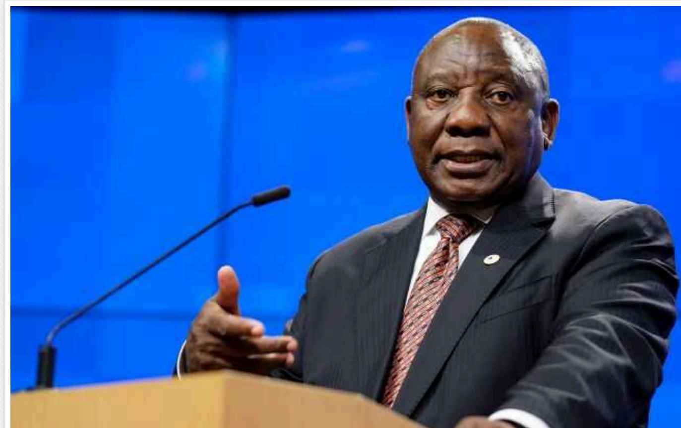
В ПАР підтримали «мирний план» КНР та Бразилії щодо завершення війни в Україні

Південноафриканська республіка (ПАР) підтримує "мирний план" з врегулювання російсько-української війни, що запропонували Китай і Бразилія.