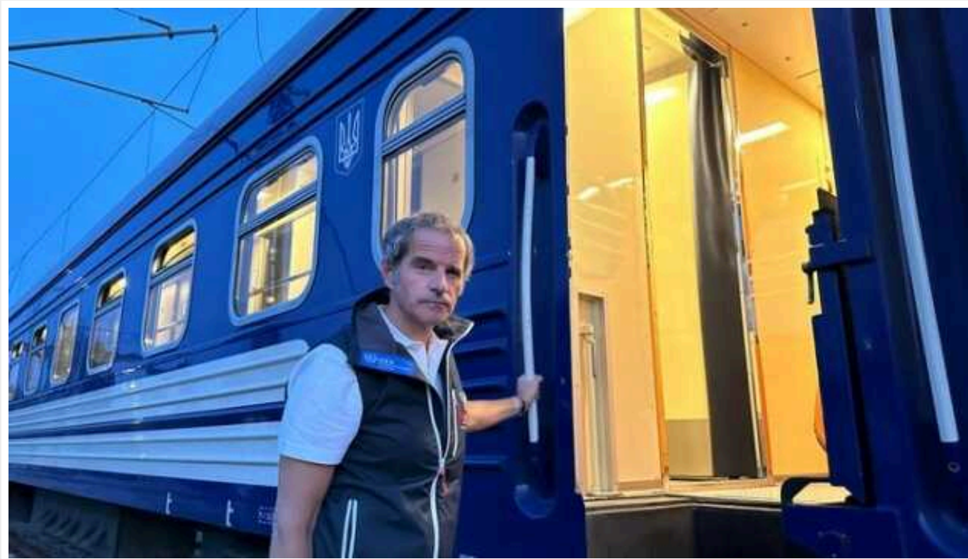
Голова МАГАТЕ Гроссі прибуде до Запорізької АЕС

Генеральний директор Міжнародного агентства з атомної енергії (МАГАТЕ) Рафаель Гроссі повідомив, що вирушає до Запорізької АЕС.