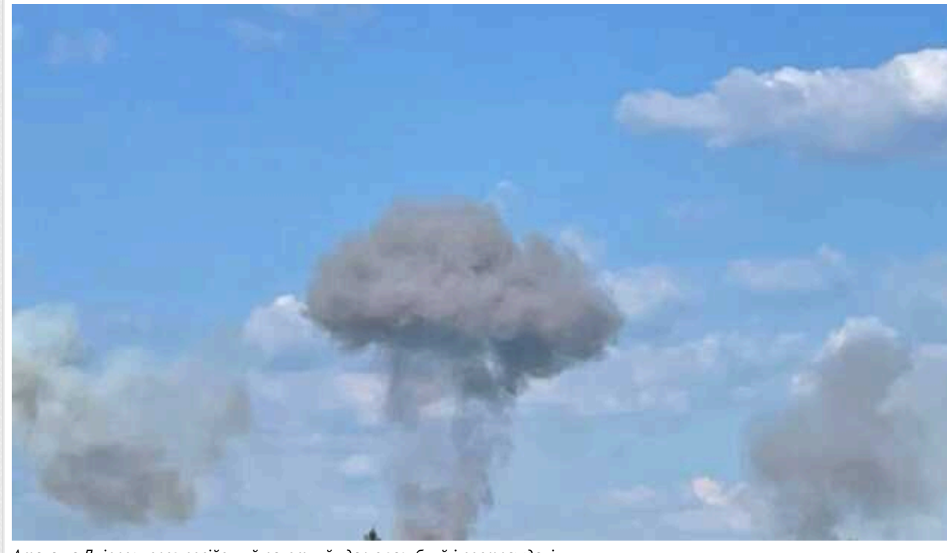
Атака на Дніпро: через російський ракетний удар є загиблій і постраждали

Сьогодні ввечері, 2 вересня, місто Дніпро зазнало атаки російських загарбників з використанням ракетного озброєння. Унаслідок ворожого удару підтверджено загибель однієї особи та наявність постраждалих.