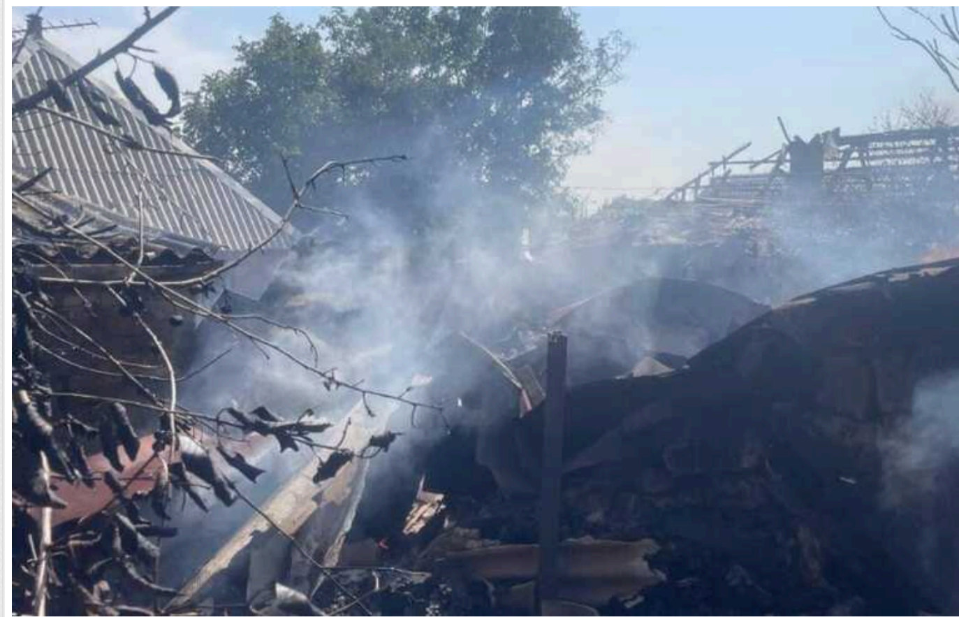
Окупанти обстріляли Нікопольщину: є постраждалі, пошкоджено інфраструктуру

У понеділок, 2 вересня, російська армія біла по Нікопольщині з артилерії та застосовувала дрони-камікадзе.