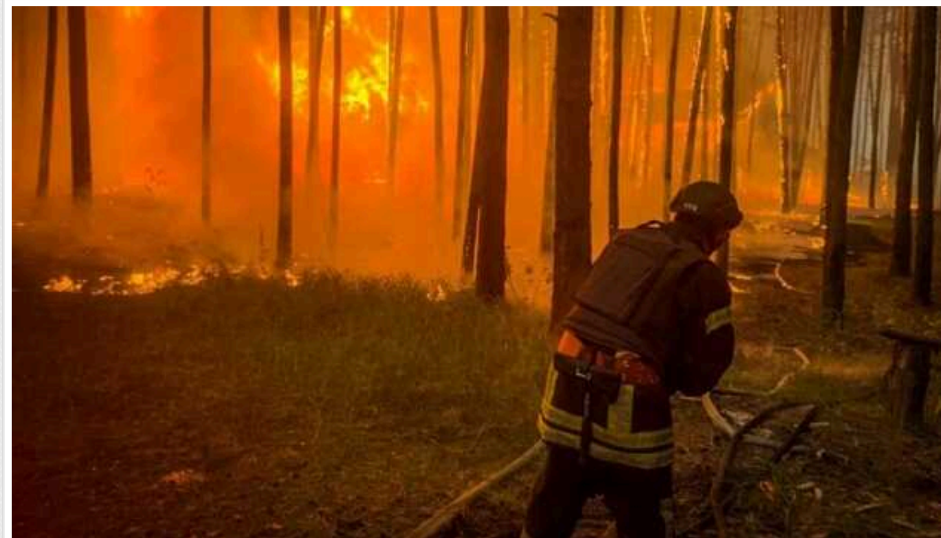
В Ізюмському районі через масштабну лісову пожежу евакуюють жителів села Студенок

У Ізюмському районі Харківської області лісова пожежа поширилася на село Студенок, триває евакуація мешканців.