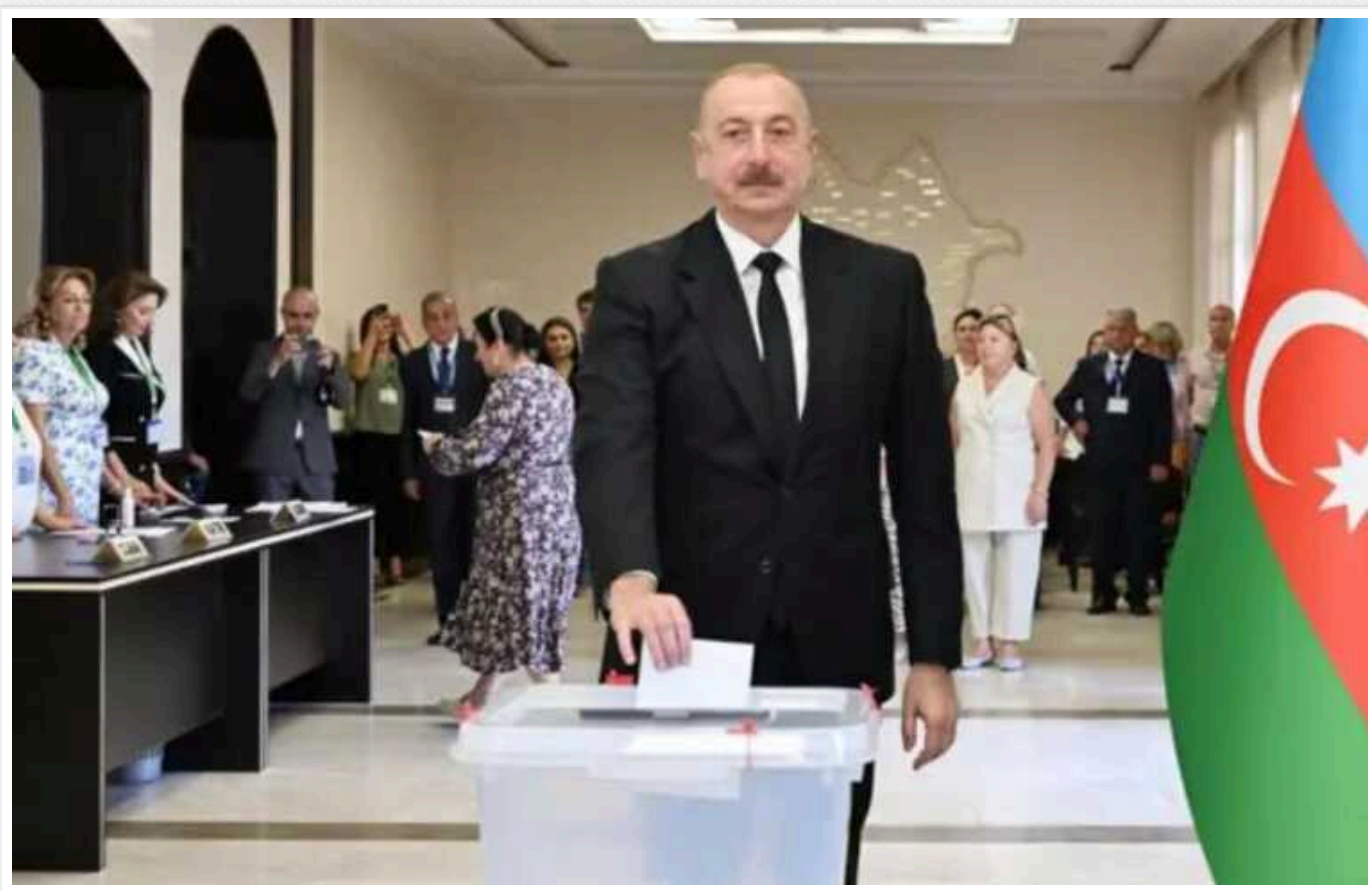
На виборах в Азербайджані перемогу здобула партія Алієва

На позачергових парламентських виборах в Азербайджані, що відбулися в неділю, 1 вересня, з невеликим відривом перемогла партія влади "Новий Азербайджан" президента Ільхама Алієва.