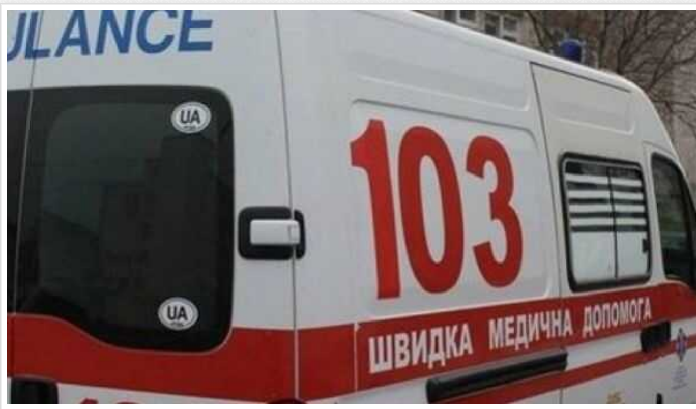
Кількість постраждалих внаслідок атаки РФ на Харків зросла до 13

У Харкові кількість людей, які постраждали внаслідок обстрілу з боку російських військ, зросла до 13.