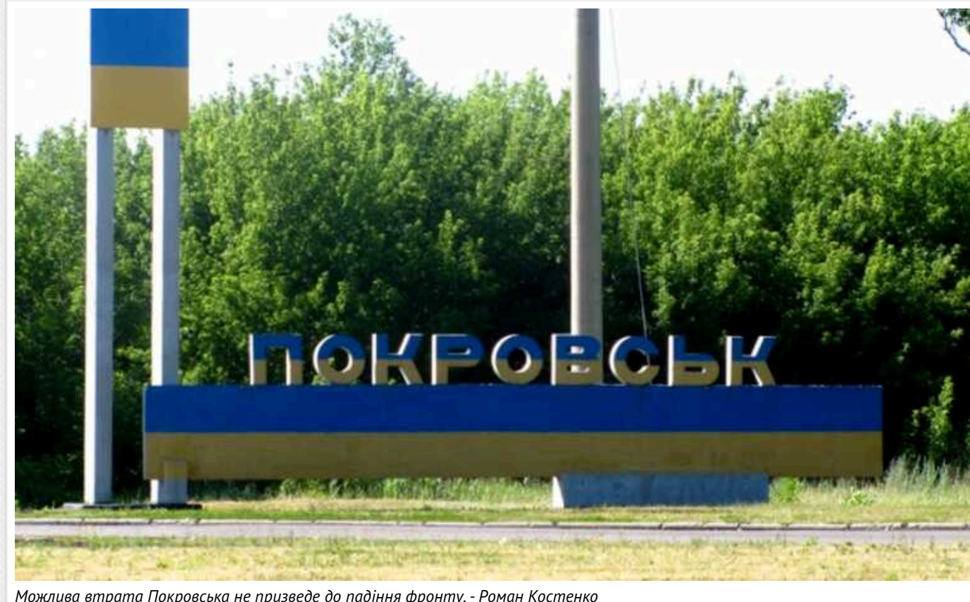
Можлива втрата Покровська не призведе до падіння фронту, - Роман Костенко

Якщо це не стане «серією лих», що справді може призвести до поразки.