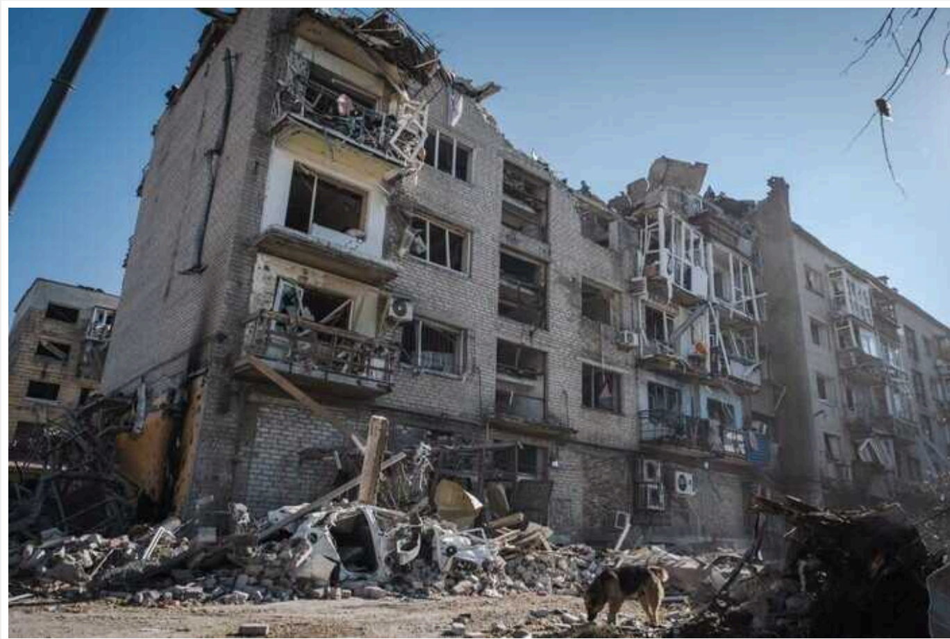
У Покровську будують лінії оборони для вуличних боїв, – МВА