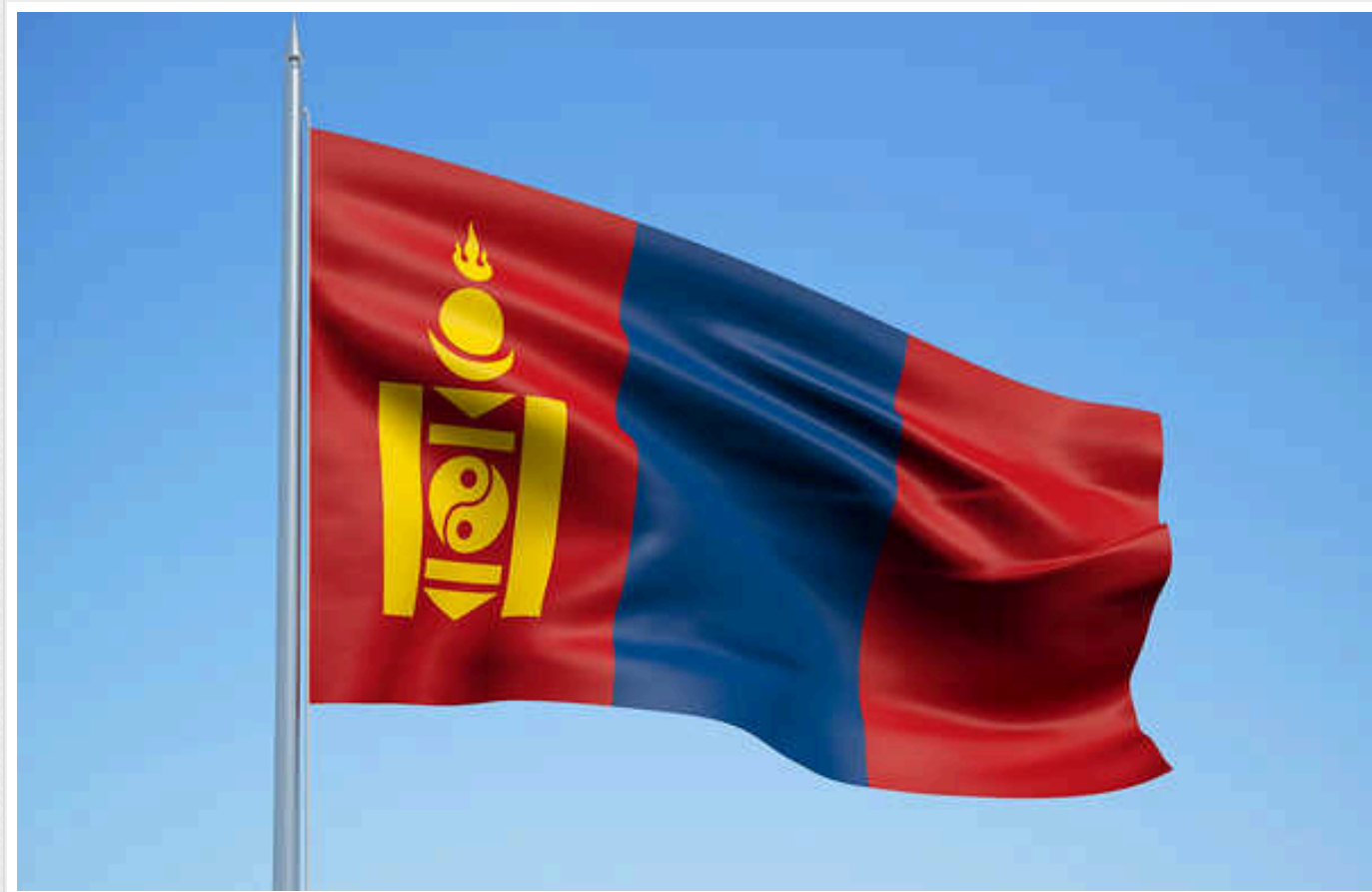
Європейський Союз нагадав Монголії, що вона зобов'язана затримати Путіна в зв'язку з ордером МКС

Європейський Союз висловив Монголії свою позицію щодо майбутнього візиту воєнного злочинця Володимира Путіна в цю країну та необхідності його затримання відповідно до ордеру Міжнародного кримінального суду.