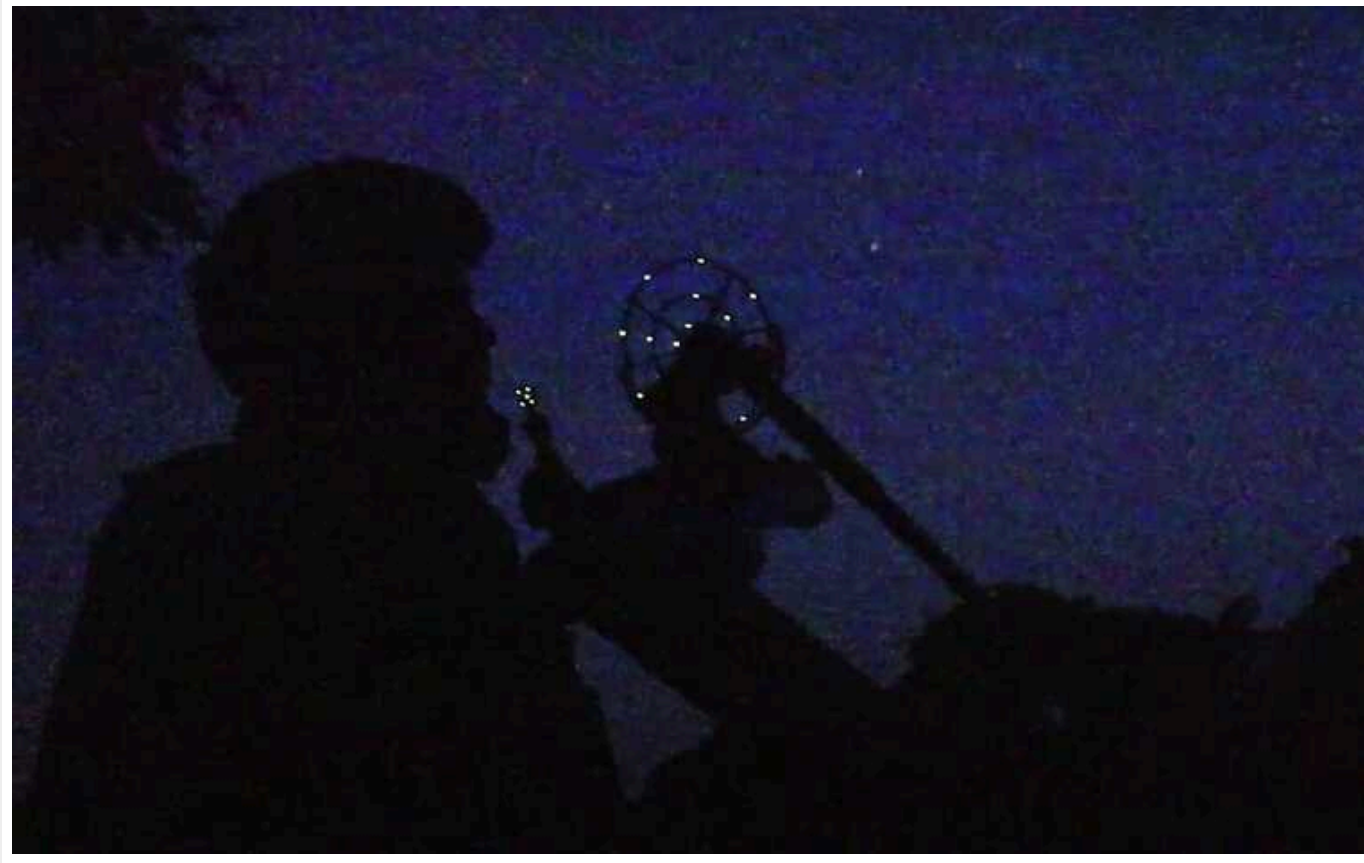
Прикордонники показали, як протидіють ворожим дронам у темну пору доби

Прикордонники на Вовчанському напрямку активно борються з ворожими безпілотниками, зокрема дронами Zala та Supercam, які російські окупанти використовують для розвідки й атак. У темний час доби на допомогу приходять мобільні вогневі групи, які ефективно знищують ворожі дрони за допомогою зенітних установок, забезпечуючи безпеку українських позицій.