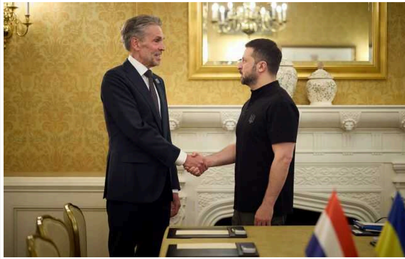
Новий прем'єр Нідерландів вперше завітав до України

Новий прем'єр-міністр Нідерландів Дік Схооф у понеділок, 2 вересня, вперше відвідав Україну. Разом з президентом Володимиром Зеленським вони побували у Запоріжжі.