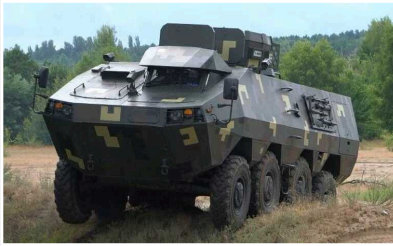
Міноборони дозволило постачання до ЗСУ українського БТР «Хорунжий»