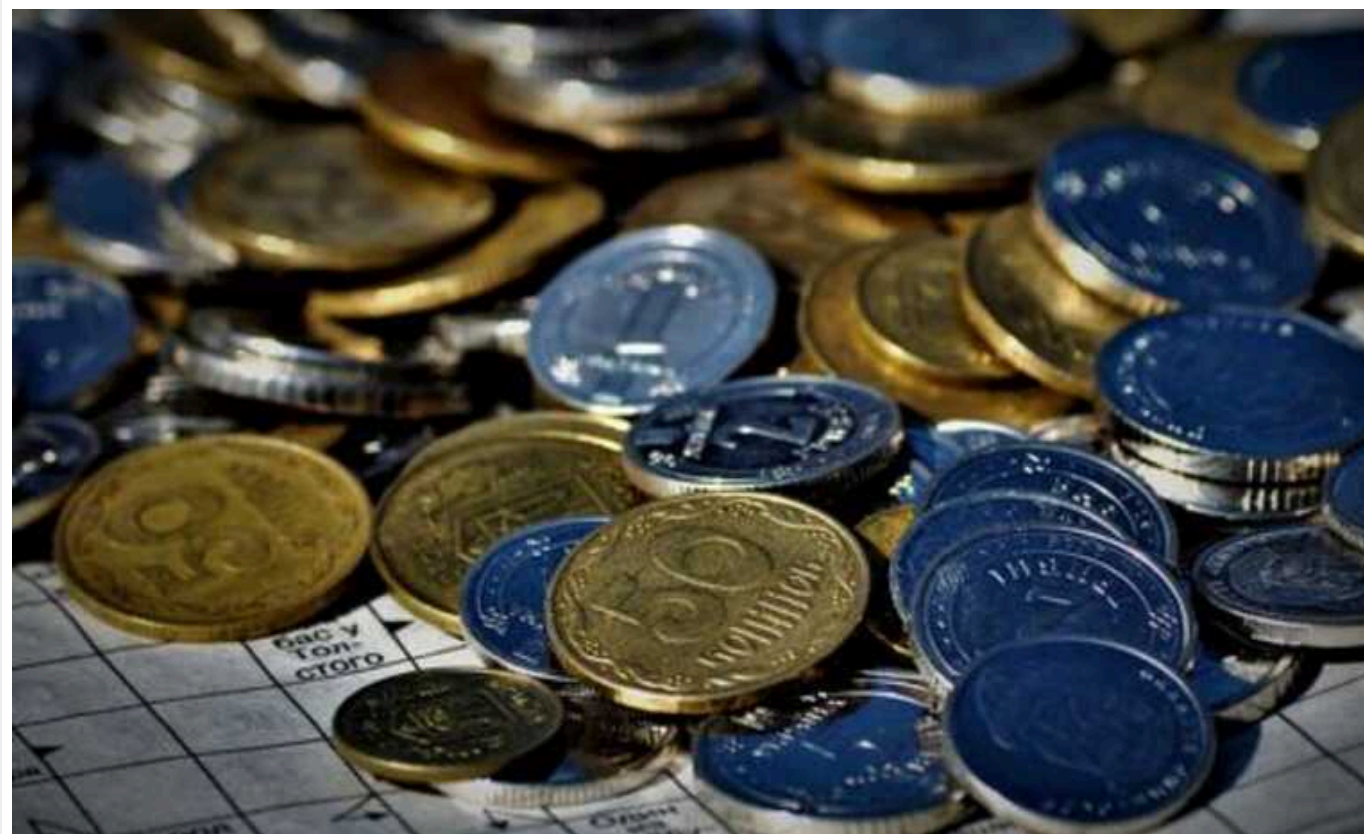
НБУ пропонує замінити копійки новими монетами під назвою "шаг", які використовувалися в XVII-XX століттях