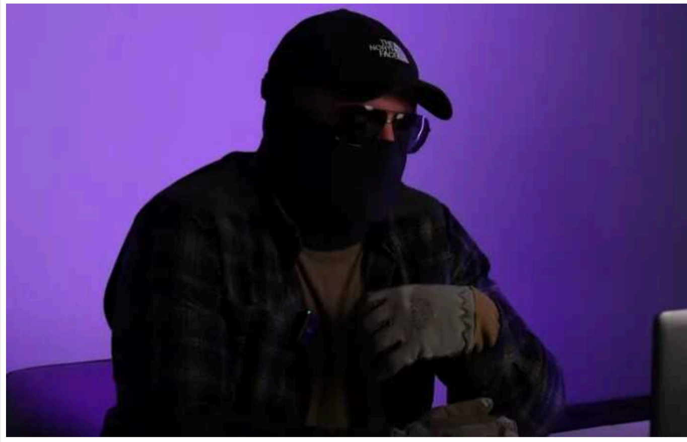
Офіцер ГУР розповів історію підпільника на псевдо "Гонта"

Сотні українців, що залишаються на окупованих територіях нашої держави, продовжують працювати на перемогу України. Вони в співпраці з воєнною розвідкою проводять ризиковані операції під носом у загарбників: вчиняють диверсії та забезпечують відплату для зрадників.