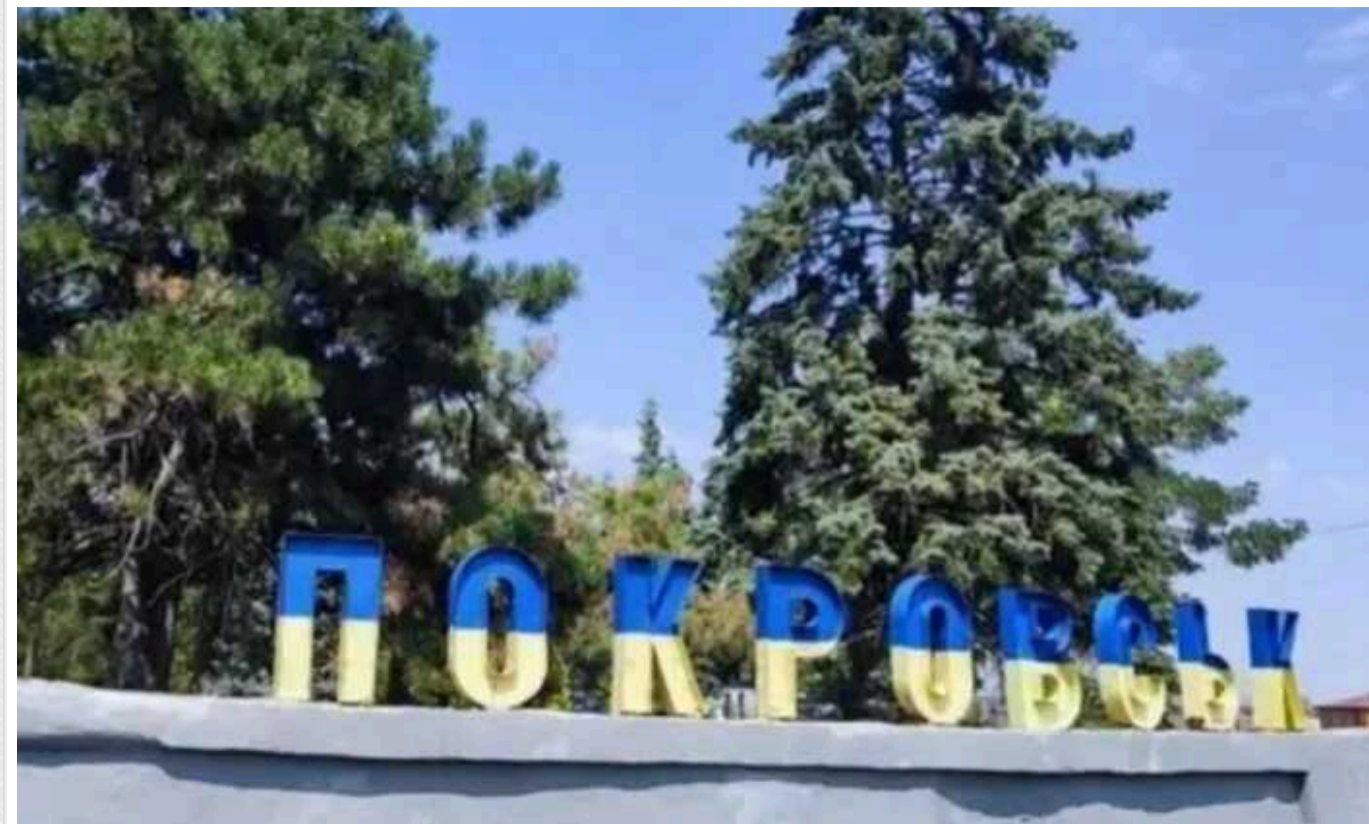
З Покровська вже евакуувалася половина населення

У місті Покровськ на Донеччині триває велика евакуація жителів у зв'язку з наближенням лінії фронту. Станом на ранок 2 вересня в місті залишилося приблизно 30 тисяч жителів, тоді як понад половину вже покинули свої домівки.