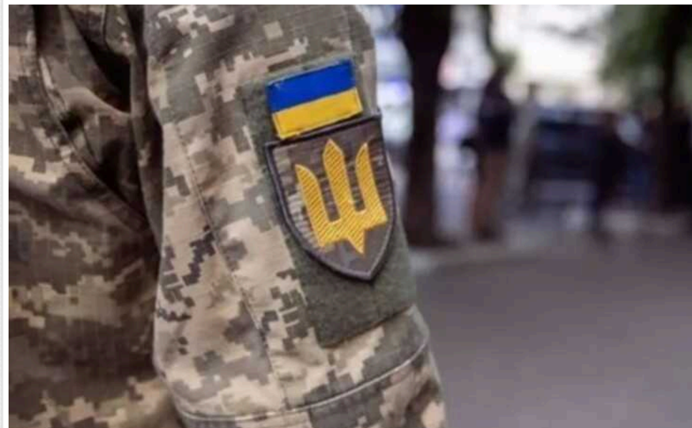
Хто має право на відстрочку від мобілізації у вересні за новими правилами

В Україні розширили категорії військовозобов'язаних, які можуть скористатися правом на відстрочку від мобілізації. Тепер військовозобов'язані, в яких загинули або зникли безвісти в умовах війни неповнорідні брати чи сестри, також можуть отримати відстрочку від призову.