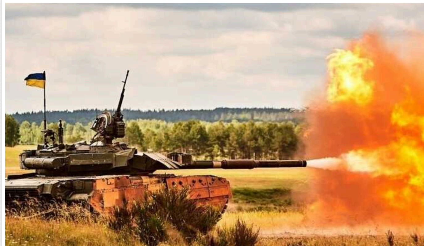
ЗСУ відбивають "дуже потужний" штурм на Донбасі: окупанти кинули в бій ту техніку, яку берегли

Лейтенант "Алекс" акцентував увагу на тому, що на Курахівському напрямку активні штурми тривають зі самого ранку. Незважаючи на посилений тиск ворога, ЗСУ вдалося захопити військовополонених.