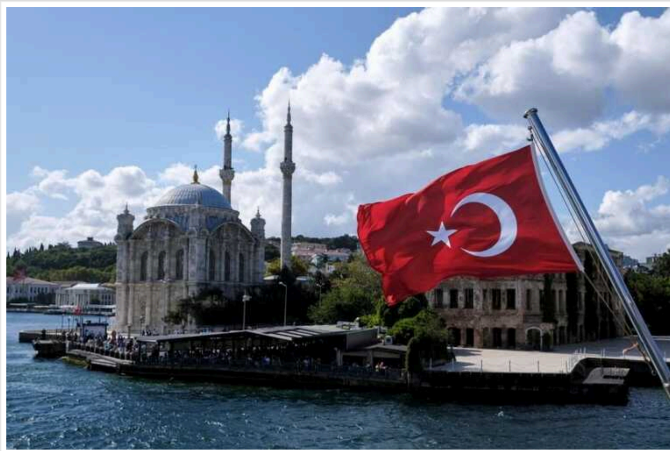
Туреччина хоче приєднатися до БРІКС, - Bloomberg

Туреччина надіслала заявку на приєднання до БРІКС, повідомляє Bloomberg, посилаючись на джерела.