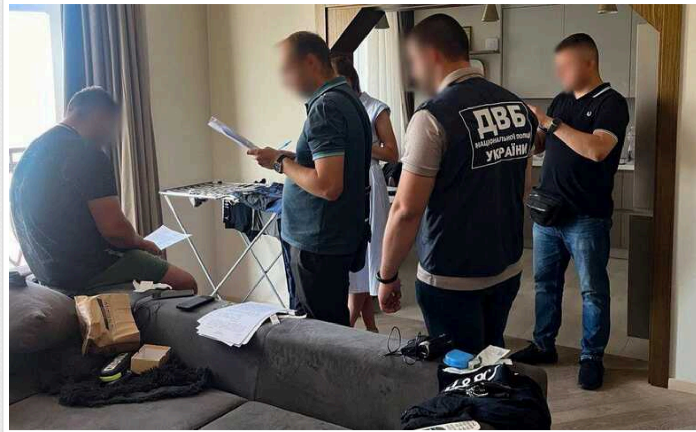
У Києві затримали чотирьох псевдоправоохоронців: погрозами змусили криптобізнесмена перерахувати їм 250 тисяч доларів

Під наглядом Київської міської прокуратури затримали чотирьом особам вивантаження у вимозани, яке завдало потерпілому значної майнової шкоди (ч. 4 ст. 189 КК України).