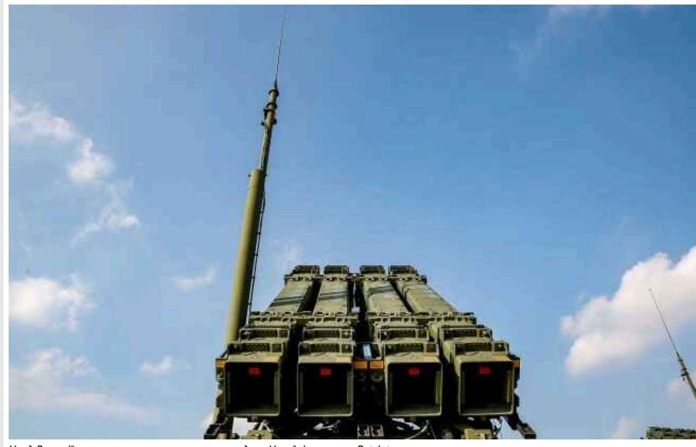
Уряд Румунії схвалив законопроект про передачу Україні системи Patriot

Уряд Румунії в понеділок, 2 вересня, затвердив законопроект, що дозволяє безкоштовну передачу Україні системи протиповітряної оборони Patriot, і направив його на розгляд парламенту.