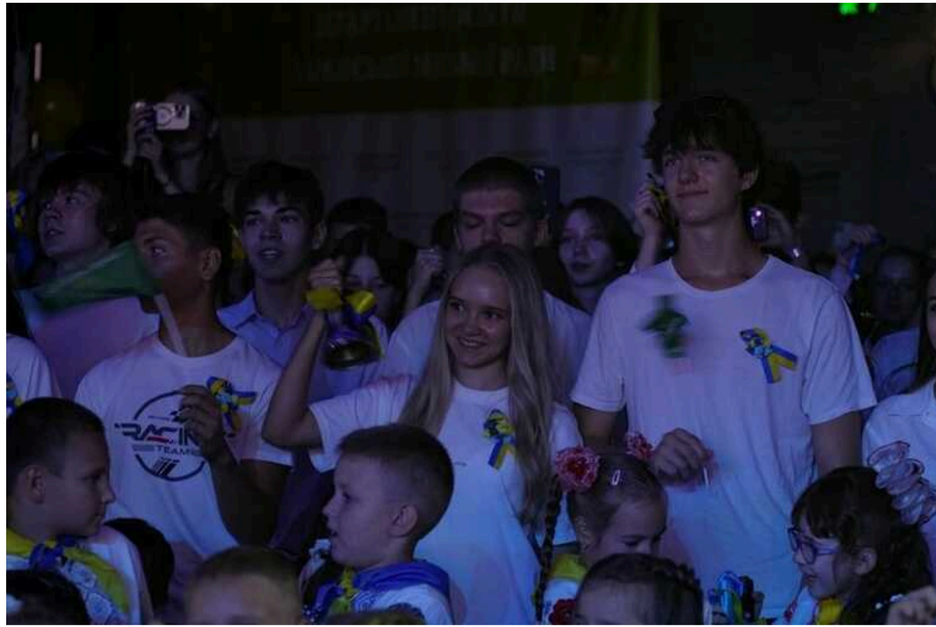
У Харкові розпочався навчальний рік: у метро та підземній школі офлайн зможуть навчатися майже 6000 дітей

Сьогодні, 2 вересня, в Харкові розпочався новий навчальний рік. У метро та підземній школі офлайн зможуть навчатися 5 800 дітей.