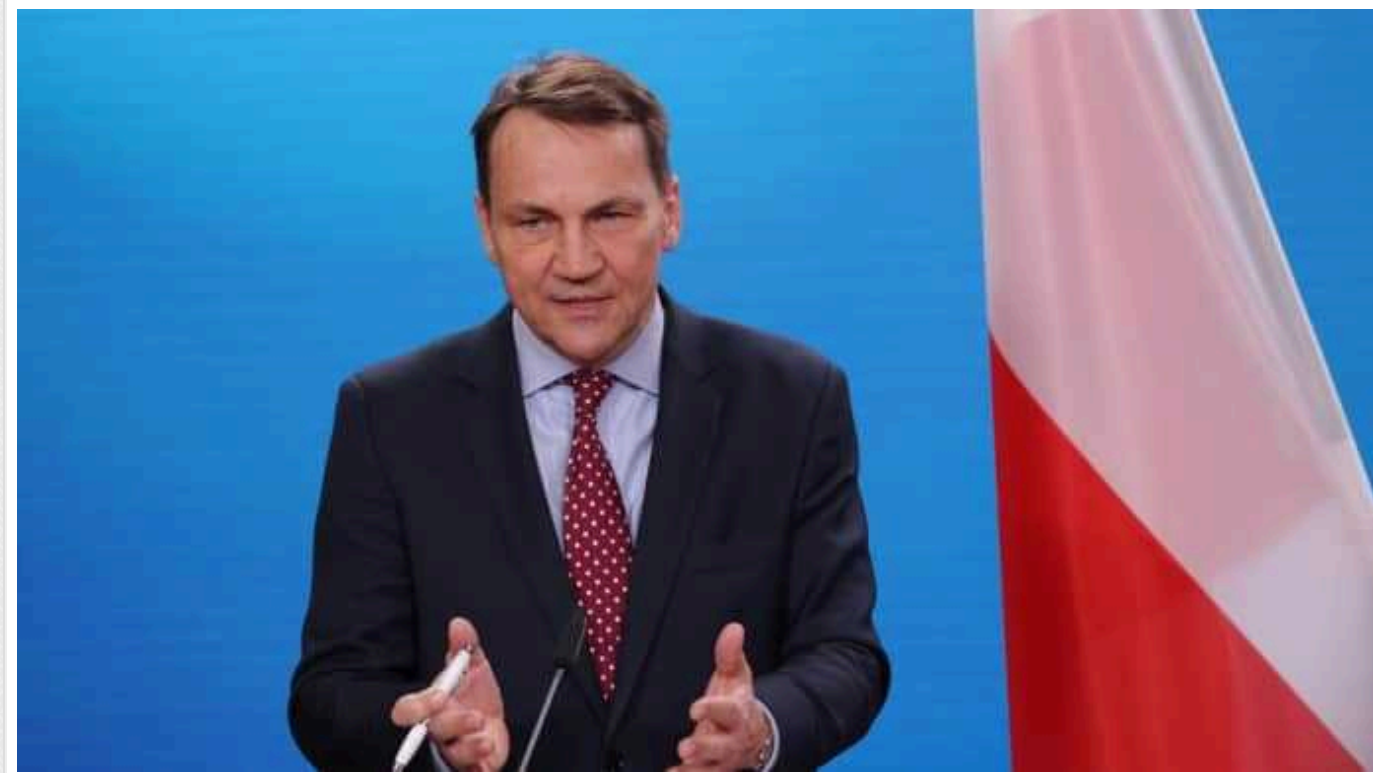
Сікорський заявив, що Польща зобов'язана збивати російські ракети над Україною

Польща та інші країни, що межують з Україною, зобов'язані збивати ракети та дрони РФ, які наближаються до їхньої території. Це потрібно робити ще до того, як ворожі цілі увійдуть у повітряний простір сусідніх з Україною країн.