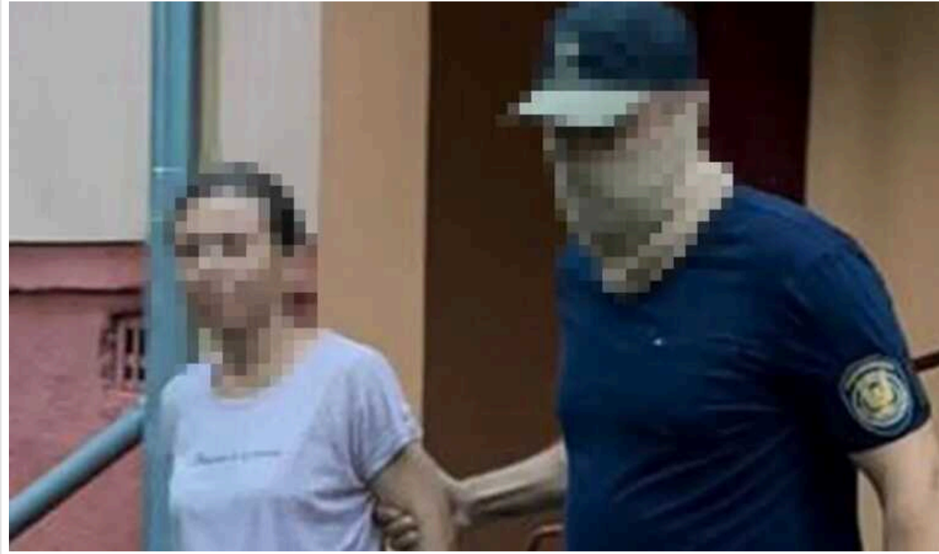
СБУ затримала інформаторку російського ГРУ: намагалася підготувати ракетний удар по Миколаєву

У Миколаєві затримали місцеву жительку, яка збирала координати об'єктів для ГРУ РФ. Завдяки цій інформації держава-агресор готувала ракетний удар по місту, "обходючи" українську ППО.